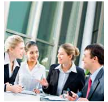
Training am Objekt