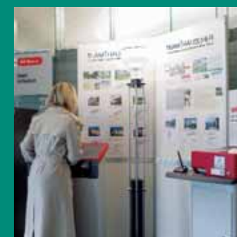
Aushang in Banken