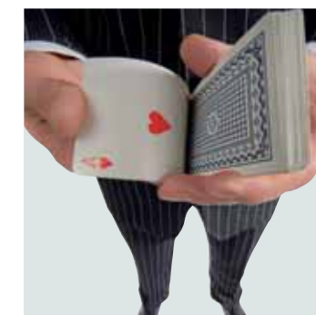
Pokern? Nein Danke.