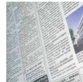
Ganz schön viel!