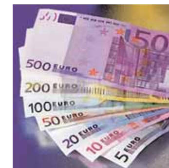
Wirklich Geld gespart?