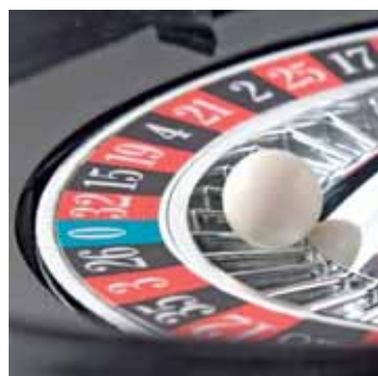
Oder auf's Glück warten?