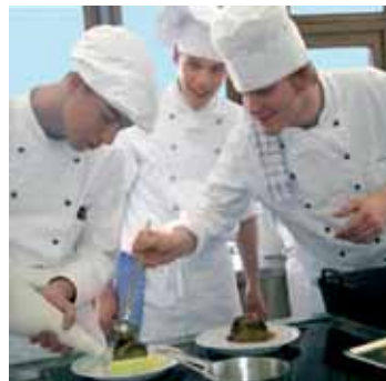
Ob das was wird?