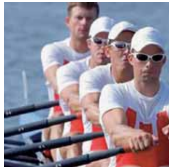
Im Team sind wir stark.

Wir sind nur erfolgreich, wenn auch Sie mit uns Erfolg haben.