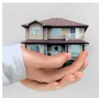
Wer nimmt mich noch?