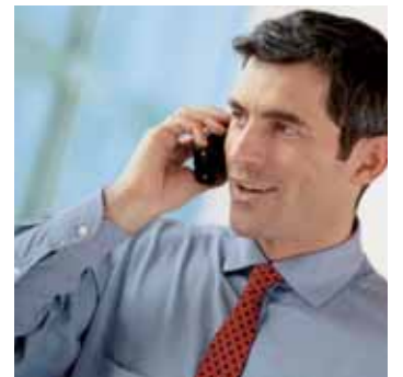
Anbieten am Telefon