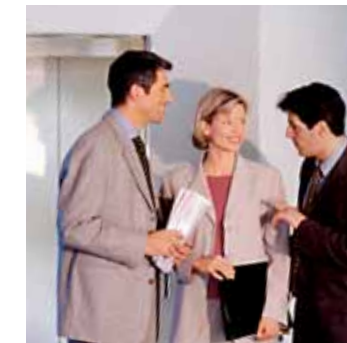
Ob die jemals kaufen?

Das längere, erfolglose Anbieten verschlechtert die Verkaufschancen erheblich.