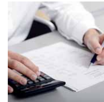
Den rechten Preis finden.

Das Wichtigste. Sie müssen ihm vertrauen können.