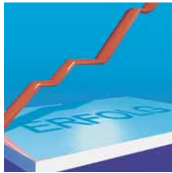
Was allein für Sie zählt.