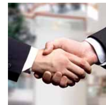
Vertrauen. Was sonst?