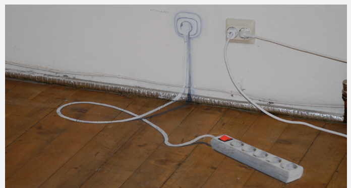
Täuschung oder Realität: Diese Verteilersteckdose ist aufgemalt.